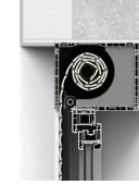
B – z zabudową od wew.